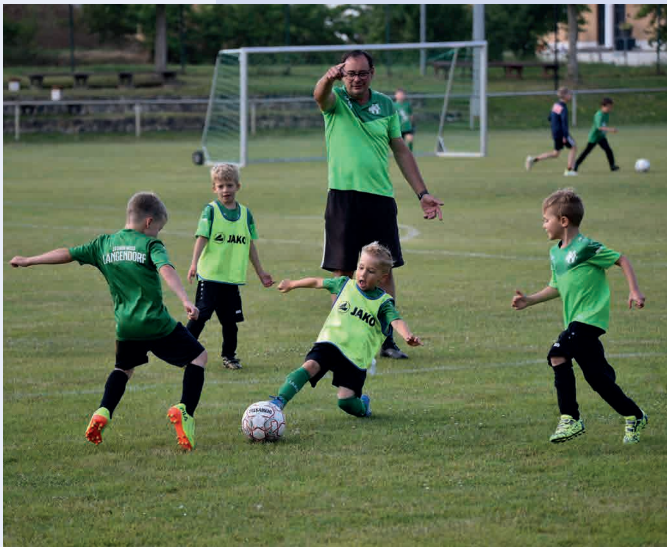
Nachwuchsarbeit beim SV Grün-Weiß Langendorf