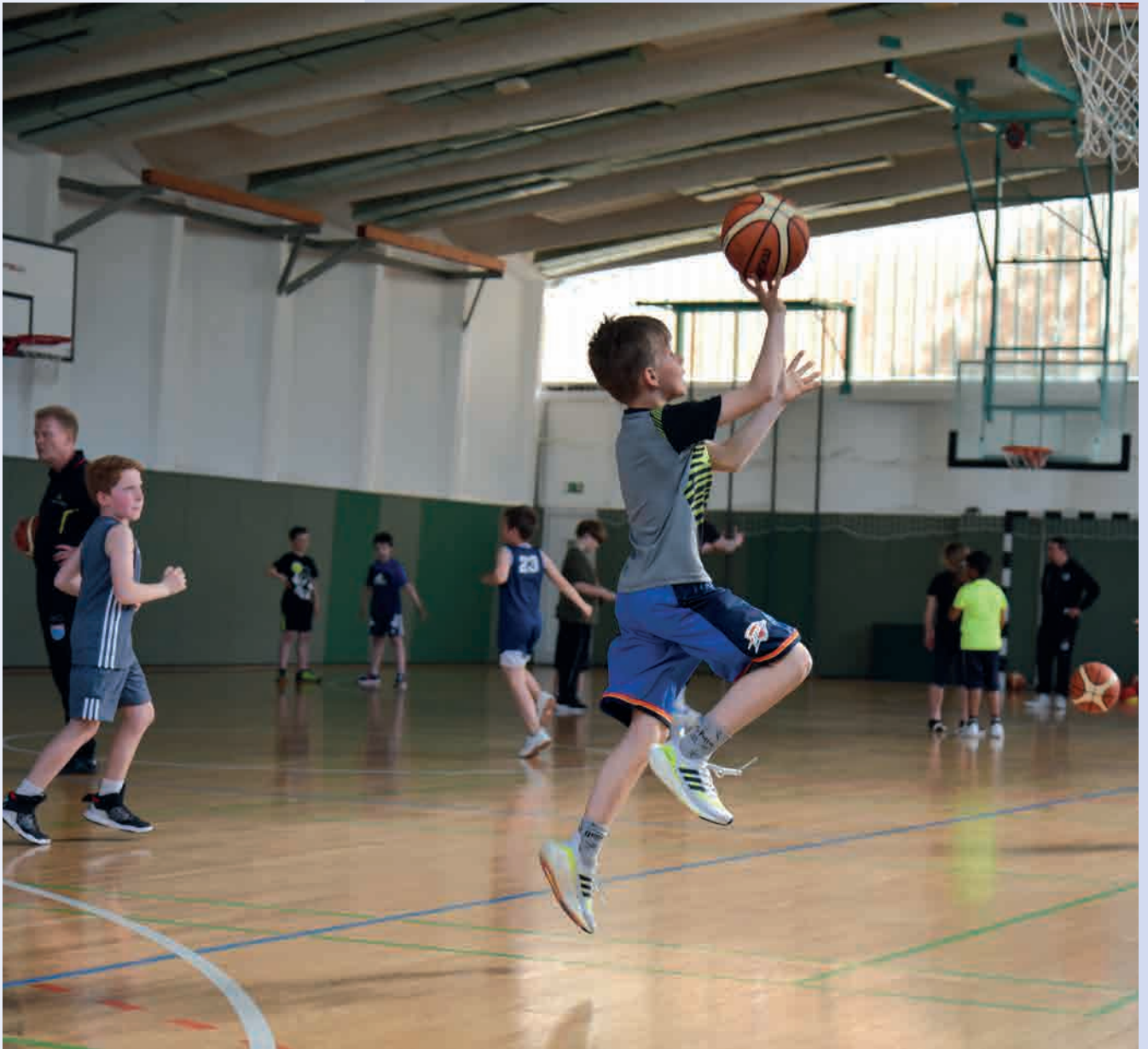
Training des MBC-Nachwuchses