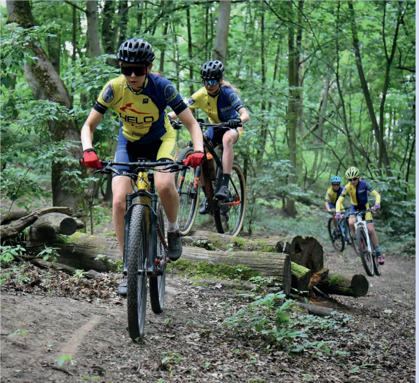
Mountainbiker des Radsportvereins White Rock