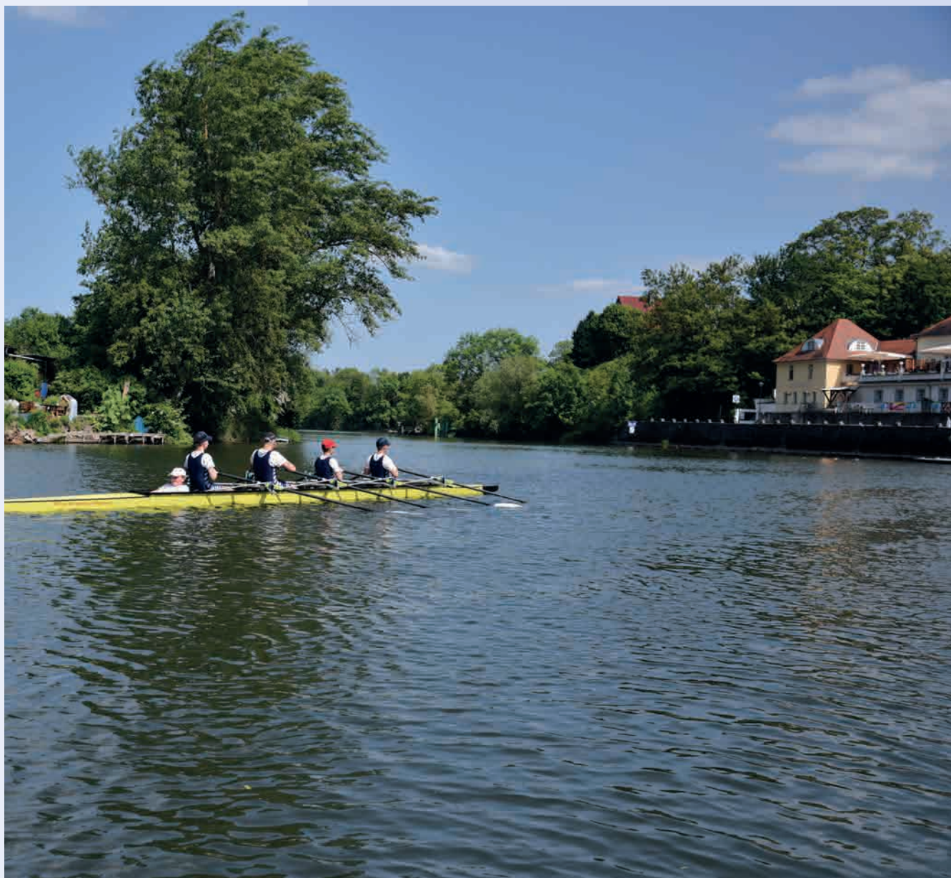
Rudertraining auf der Saale vor dem Bootshaus Weißenfels