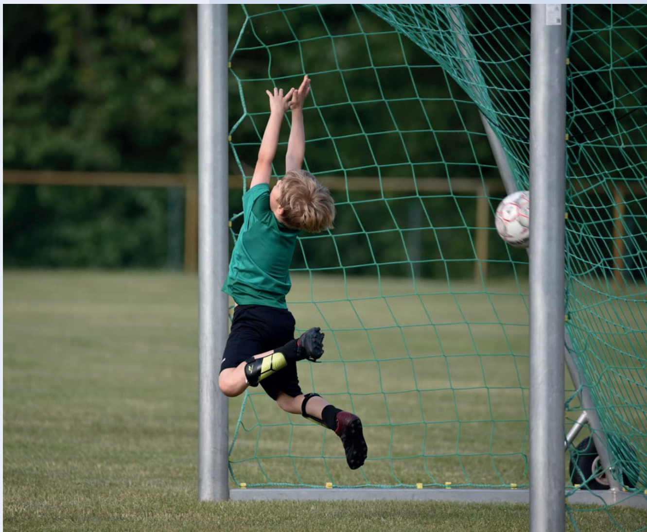
Trainingsszene SV Grün-Weiß Langendorf