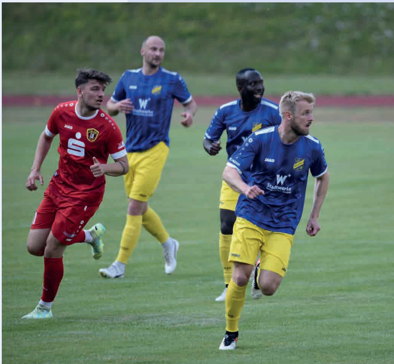
Ligaspiel des SSC Weißenfels